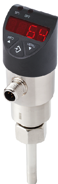
Fig. 3: Chave de fluxo calorimétrica – também nomeadas monitores de nível – são frequentemente usadas para monitorar a presença de um fluxo em um sistema de tubulação