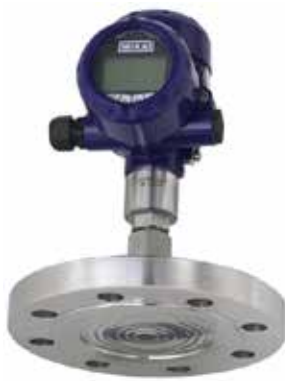
Transmissor de pressão com selo diafragma flangeado