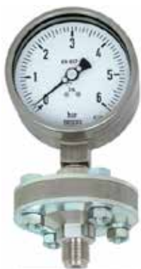
Manômetro com selo diafragma do tipo rosca

Membrana, flange de conexão e vedações, consideradas “partes molhadas”, são expostas ao processo. Por isso, essas partes precisam ser construídas com materiais resistentes a pressões, temperaturas e possíveis ataques químicos, ou seja, elas precisam ser