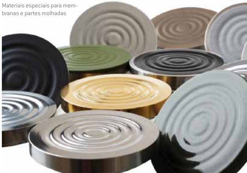
Materiais especiais para membranas e partes molhadas

A conexão ao processo é determinada pelo cliente. A maioria das conexões são roscadas, flangeadas ou do tipo sanitárias, embora existam conexões especiais. Soluções específicas também podem