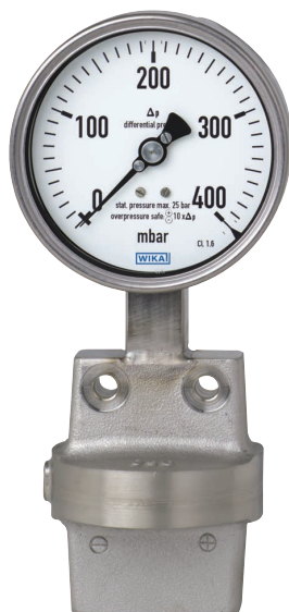
Modelo 732.51.100 conforme ATEX