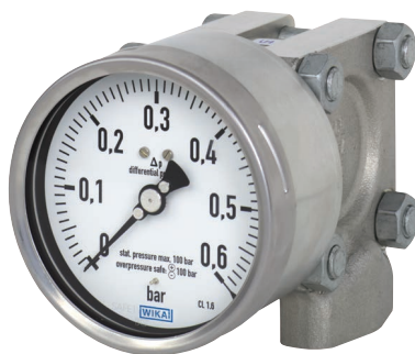
Modelo 732.14.100 conforme ATEX