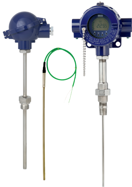
Sonde di temperatura in esecuzione criogenica

I dati dei test condotti nell'ambito di indagini di laboratorio hanno funto da base per il calcolo dei nuovi polinomi delle termoresistenze Pt1000 nel campo di temperatura di -258 ... -200 °C [ -432 ... -328 °F] usate nella configurazione dei trasmettitori WIKA.