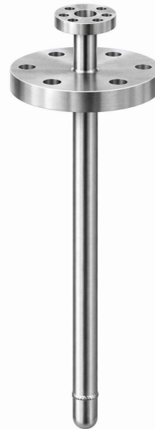
TW95-S vaina de barra con brida