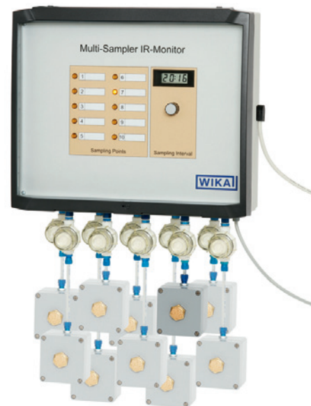
Campionatore multiplo per il monitoraggio delle emissioni, modello GA33