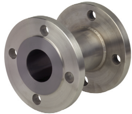
用于法兰连接的圆筒型隔膜密封， 981.27型