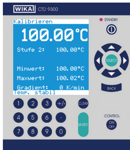
Menù per misura e calibrazione

Con lo strumento di misura, che può essere montato anche successivamente in calibratori esistenti, è possibile misurare e convertire in temperatura Pt100, termocoppie e correnti 0/4 ... 20 mA; anche come confronto a una sonda campione esterna. Le calibrazioni automatiche sono possibili usando un PC/laptop e il software di calibrazione.