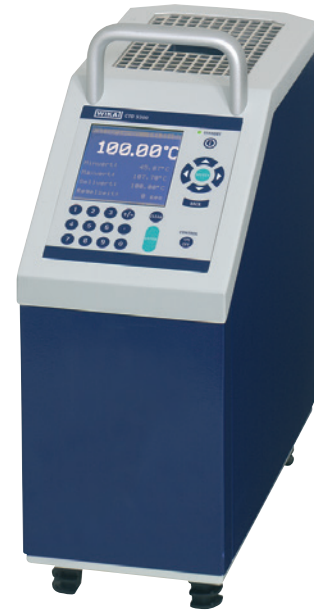
Calibratore di temperatura a secco modello CTD9300, senza strumento di misura integrato