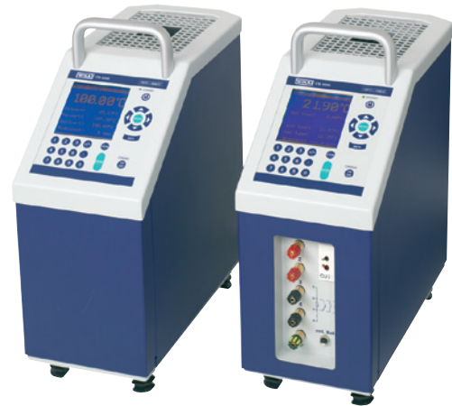
Fig. a sinistra: senza strumento di misura integrato Fig. a destra: con strumento di misura integrato