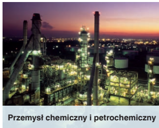
Przemysł chemiczny i petrochemiczny