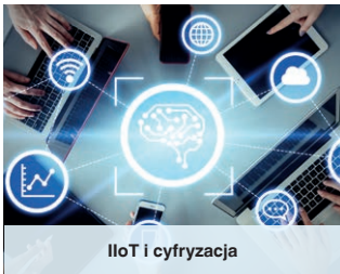
IIoT i cyfryzacja