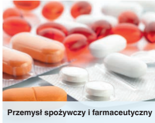
Przemysł spożywczy i farmaceutyczny