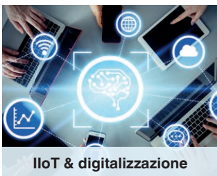
IIoT & digitalizzazione