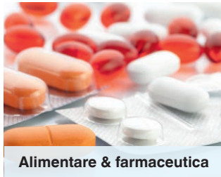
Alimentare & farmaceutica