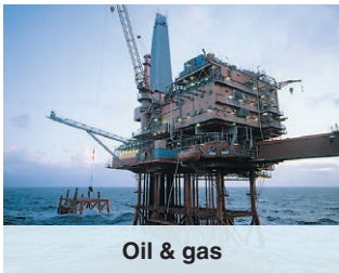
Oil & gas