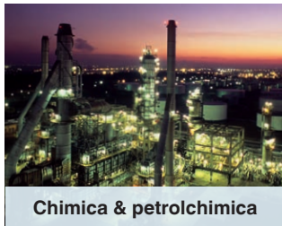
Chimica & petrolchimica