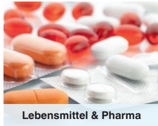
Lebensmittel & Pharma