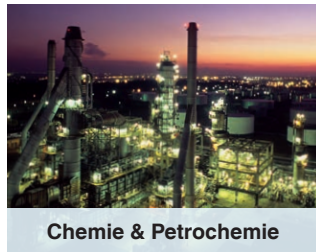
Chemie & Petrochemie