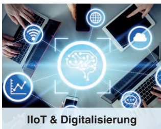
IIoT & Digitalisierung