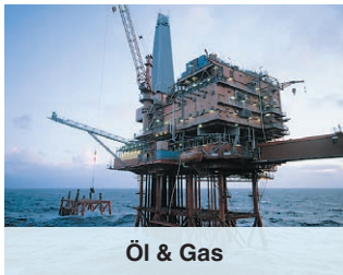
Öl & Gas