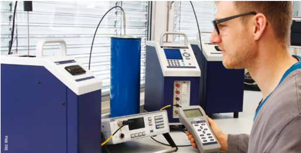
Im Kalibrierlabor: Für SIL-Messstellen sind wiederkehrende Überprüfungen vorgeschrieben.

peraturfühlers. Statistiken dazu finden sich in entsprechenden Nachschlagewerken, doch sind sie eher allgemein. Übertragen auf ein Auto, ließe sich aus solchen Informationen die Aussage ableiten: Bei guter Pflege hält ein Pkw mehrere 100.000 Kilometer. Aber jeder weiß, dass ein Rennfahrer den gleichen Wagen binnen Stunden zermürben könnte. Daher sollte man sich bei diesem Punkt der Messstellen-Sicherheit auf die tatsächliche Anwendung konzentrieren, auf die Prozessbedingungen und ihre Extrema.