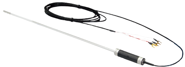
标准铂电阻温度计, 型号CTP5000-T25